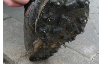
„Autsch!“ - Ines Grunau hat sich einen Nagel in den Schuh getreten,

Um einige Zeit länger als geplant war JWM-Teilnehmerin Ines Grunau von DJK Adler 07 Bottrop beim 23. Bottroper Volks-Orientierungslauf am 9. März 2008 unterwegs. Sie hatte sich in dem Gelände der alten Zeche Arenberg-Fortsetzung einen 5 cm langen Nagel in den Schuh getreten - Weiterlaufen unmöglich! Da half nur eines: Die getapten Schuhbänder lösen, Schuh ausziehen und mit Hilfe der Fotografin und mit Steinen als Werkzeug den krumm getretenen Nagel aus dem Schuh herausziehen. Glücklicherweise hatte der Nagel am Fuß nur eine Druckstelle hinterlassen, so dass die junge Läuferin ihren Lauf nach fast 10minütiger Unterbrechung fortsetzen konnte. Karin Schlaefke